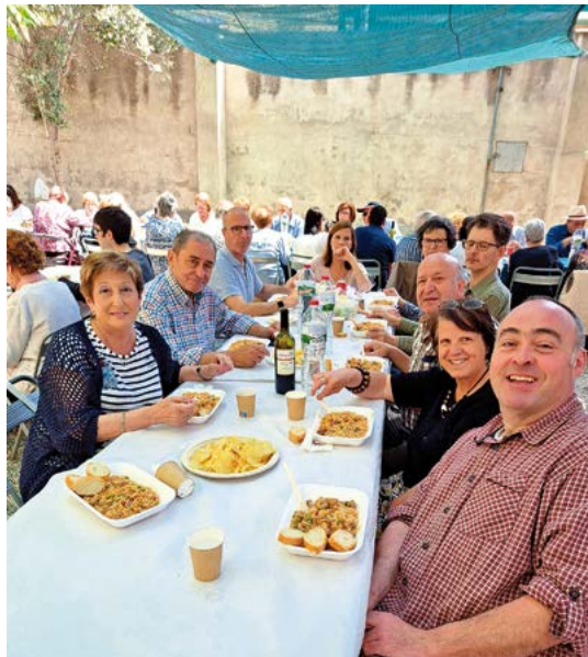
Paella solidària a la rectoria de Piera