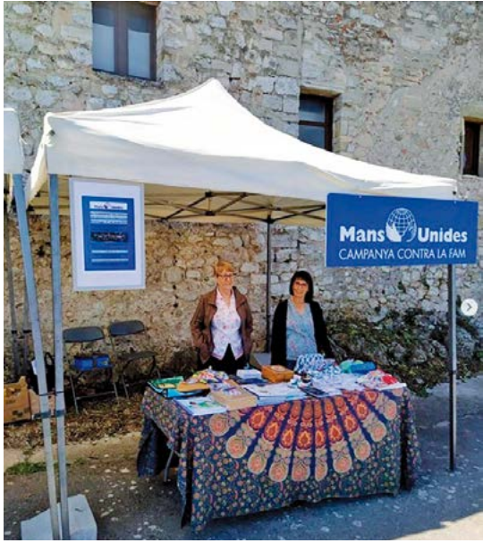
Parada de Mans Unides a l'Aplec de Subirats, 1 de maig de 2023

Aquest és el lema de Mans Unides en la seva campanya d'aquest any, que té el seu punt àlgid al mes de febrer, amb la Campanya contra la Fam, però que s'estén al llarg de tot l'any. Nombroses activitats, desenvolupades per les diverses delegacions territorials, mantenen viva la consciència solidària pels que ho passen pitjor als països del tercer món.